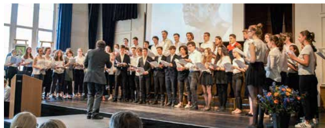
Auch Schulorchester und Chor kamen zu Wort.