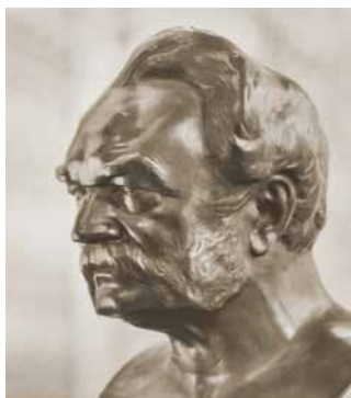
Namensgeber Werner von Siemens.