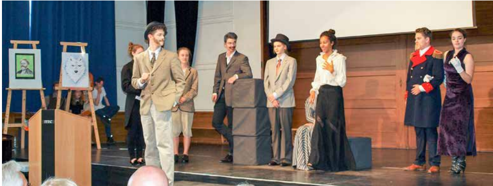
Herr von Siemens und berühmte Zeitgenossen gaben sich die Ehre.

im Jahr 1908 als Malwida-von-Meyensbug-Schule gegründet worden. Nach der künstlerfreundlichen Schriftstellerin benannt, war sie damals eine der ersten fortschrittlichen Schulen Berlins, an der Jungen und Mädchen gemeinsam unterrichtet wurden. So wie ihr Namensgeber, zeigte sich auch die Schule während der vergangenen 50 Jahre fortschrittlich und weltoffen.